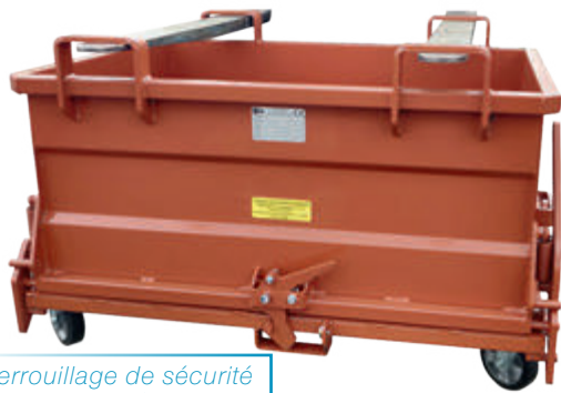
Verrouillage de sécurité automatique