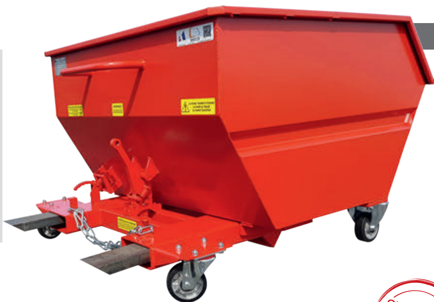
Option bac de rétention